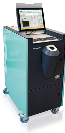
Innovative Messtechnologie (IAG-ng) als Herzstück unseres Messbusses

Besonders vorteilhaft ist das Emissions-Service im Vorfeld einer behördlich angeordneten Messung. Denn die vorbereitende Messung und unsere Handlungsempfehlungen bieten Ihnen die Sicherheit einer emissionsnormkonform laufenden Anlage als optimale Voraussetzung für die behördliche Emissionsmessung.